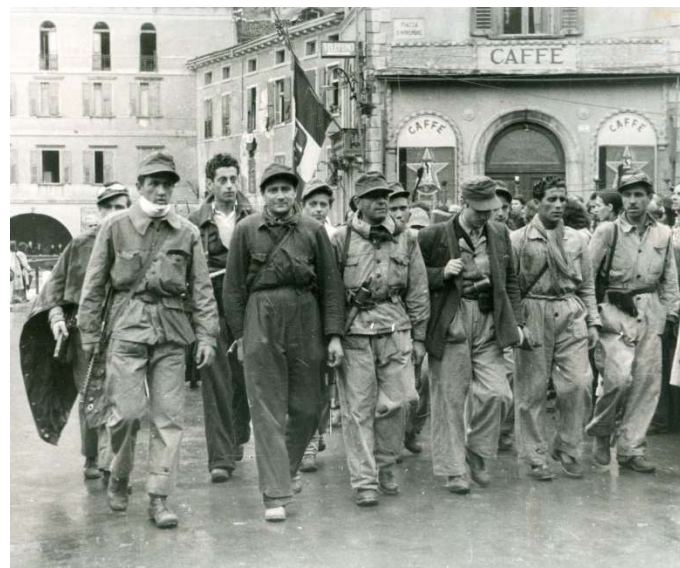
Operai della FIAT e la liberazione di Riva